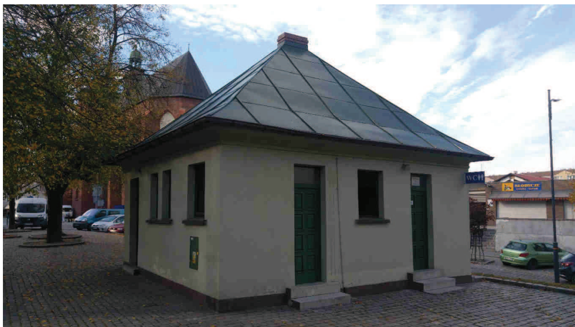
Zdj. nr 1. Widok na elewację południową i wschodnią.