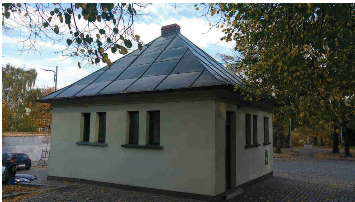
Zdj. nr 2. Widok na elewację zachodnią i południową.