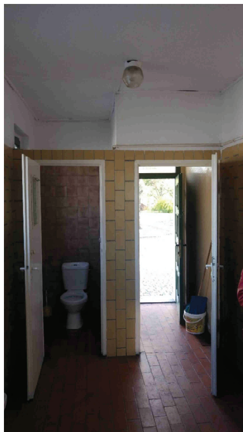
Zdj. nr 6. Pom. 0.1 – umywalnia męska. Widok na pom. 0.2 i 0.3.