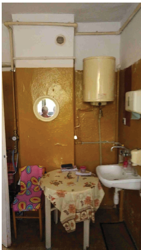
Zdj. nr 7. Pom. 0.5 – pom. kasjera