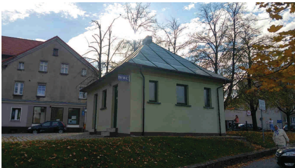
Zdj. nr 3. Widok na elewację wschodnią i północną od ul. Króla Stefana Batorego.