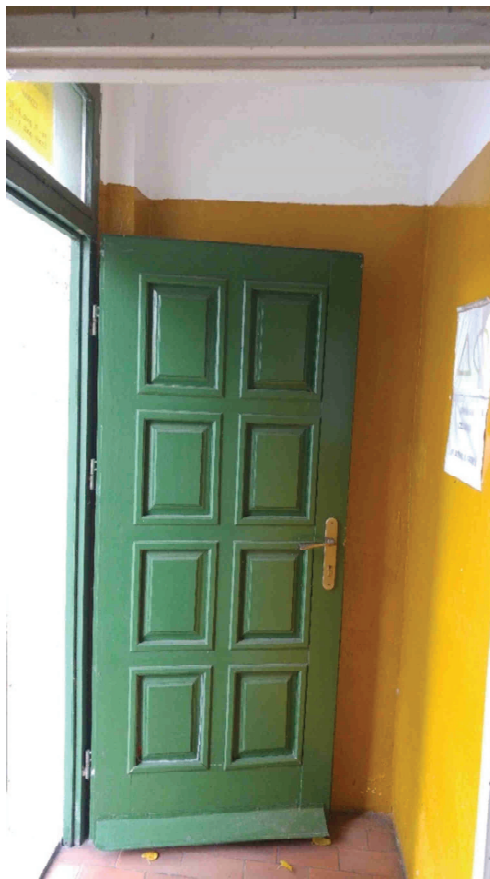
Zdj. nr 10. Pom. 0.10 – wiatrołap.