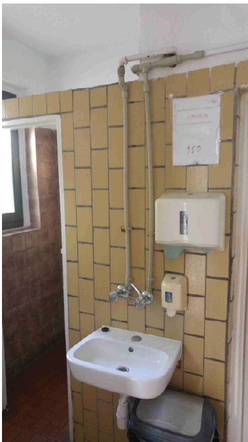
Zdj. nr 9. Pom. 0.9 – umywalnia. Widok na pom. 0.6 – WC damskie 1.